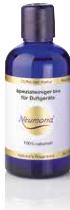
61210 Spezialreiniger bio für Duftgeräte