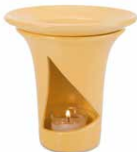
61655 Duftlampe „Toscana“, Keramik pastellgelb