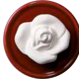
5657 Duftstein „Rose“ mit festem Untersetzer, ø7cm 1St. 5,90€