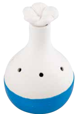
5559 Duftkeramik-Vase blau, mit Blüte 2tlg. 7,90€ ca. 9cm hoch, ø ca. 7cm