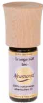
2471 Duft-Kappe aus Holz 1St. 1,50€ für äth. Öle, kann mit 3-5 Tr. beduftet und einfach auf die Kappe des ätherischen Öles aufgesetzt werden.