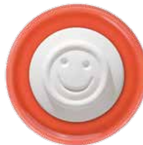
5663 Duftkeramik „Smiley“, ø 5cm, ohne Untersetzer 1St. 3,50€