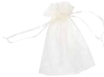
3715 Geschenksäckchen „Organza“, 10x14cm, champagnerfarben mit Zugbändchen 1St. 0,90€