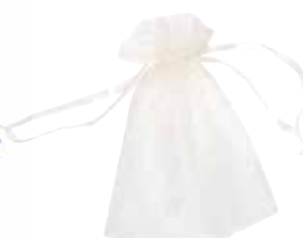
3717 Geschenksäckchen „Organza“, 14x23cm, champagnerfarben mit Zugbändchen 1St. 1,45€