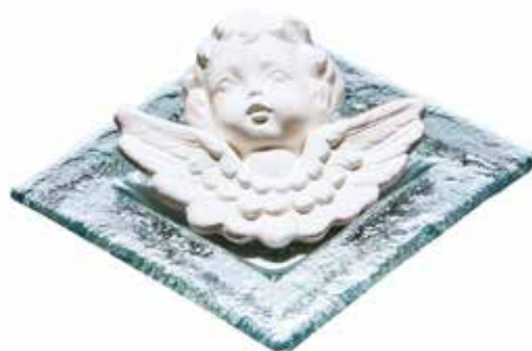
5511 Duftkeramik-Figur „Engel mit Glas“ 2tlg. 8,90€ mit Glasuntersetzer, viereckig, 4cm hoch, ø10cm