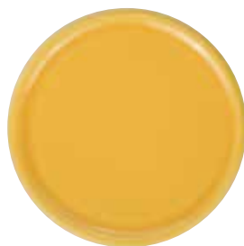
5785 Untersetzer für Duftkeramik, gelb glasiert, ø7cm 1St. 2,90€