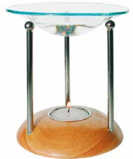
5410 Duftlampe „Aroma Light“