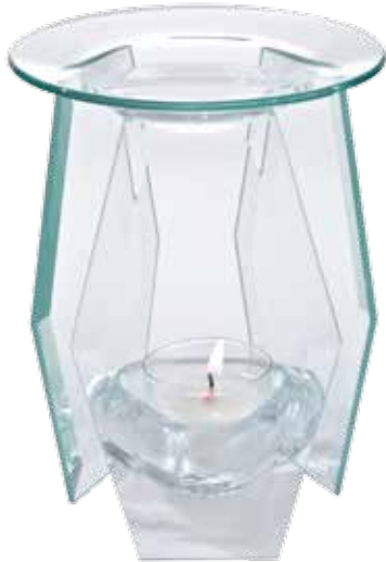
5401 Duftlampe „Kristall“

Die klassische Kerzen-Duftlampe erfreut sich nach wie vor größter Beliebtheit. In Neumond Kerzen-Duftlampen verbinden sich ansprechendes Design und durchdachte Funktionalität.