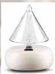
64110 Aroma-Zerstäuber „Profumo“ 1St. 94,50€

Für Anwender aus dem professionellen Bereich stellt Neumond bewährte 100% naturreine Düfte und hocheffiziente Objekte zur Raumbeduftung bereit. Unser Ziel ist es, Ihnen das Aromatisieren von Praxen und Patientenzimmern, Gasträumen, Läden und Geschäftsflächen so einfach wie möglich zu machen, – bei maximaler Effizienz und Wirksamkeit mit 100% naturreinen Düften.