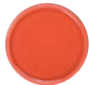
5751 Untersetzer für Duftkeramik, korallrot glasiert, ø7cm 1St. 2,90€