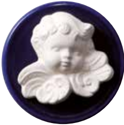
5654 Duftstein „Engel“ mit festem Untersetzer, ø7cm 1St. 5,90€

Einige Tropfen Ihres Lieblingsduftes machen die Duftkeramiken zu einem ansprechenden Wohnaccessoire. Die saugfähige und unglasierte Spezialkeramik nimmt die feinen Neumond-Düfte besonders gut auf und gibt sie sanft und anhaltend wieder frei. Bitte denken Sie daran, dass die Duftkeramiken zum Schutz Ihrer Möbel stets auf einem Untersetzer liegen sollten.