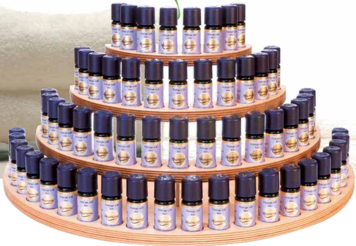
3806 Design-Display Birkenholz (leer) für 60 Fläschchen 1St. 139,00€ halbrund, natur lasiert, 48cm breit, 20cm hoch, 24cm tief

Die ästhetisch gestalteten Displays gewährleisten Ihnen jederzeit Zugriff auf Ihre ätherischen Öle.