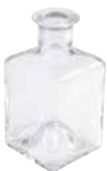
5439 AQUAROMA- Duftglas qua- dratisch (leer, ohne Stäbe)

1St. 3,90€ Duftglas für AQUAROMA, quadratisch, Glas: 6x6cm, 12cm hoch