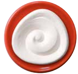
5659 Duftstein „Spirale“ mit festem Untersetzer, ø7cm 1St. 5,90€