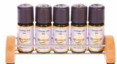
2477 Display Holz- Edelstahl, leer, für 5 Fläschchen 1St. 12,90€ Elegantes Buchenholz-Design mit Edelstahlstäben und rutsch- fester Auflage. 15cm breit, 6cm tief, 3cm hoch.