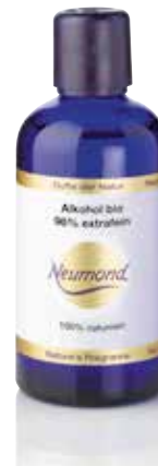
61202 Alkohol bio 96% extrafein

Spezialreiniger für die gründliche Reinigung von Duftgeräten von Resten ätherischer Öle. Der Spezialreiniger ist auf der Basis von reinem Bio-Alkohol hergestellt, Bedarf etwa 10-20ml je Reinigungsvorgang.