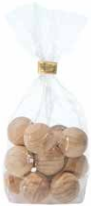
2473 Duft-Dekokugeln aus Holz 12St. 1,50€ für Dekoschalen und Potpourris zum Beduften mit ätherischen Ölen, ø2cm, 12er-Pack