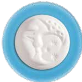
5650 Duftkeramik „Mond“, ø 5cm, ohne Untersetzer 1St. 3,50€