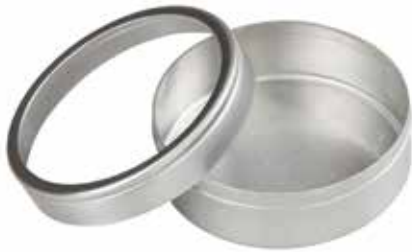
2750 Dose für Duftkeramik, ø5cm Ideal für die Reise, 1St. 2,90€