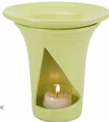
61659 Duftlampe „Toscana“, Keramik hellgrün

„Toscana“ ist eine klassische Keramik-Duftlampe mit abnehmbarer Schale. Die beliebte Duftlampe „Toscana“ ist in den Farbtönen hellgrün, pastellgelb, und himmelblau erhältlich.