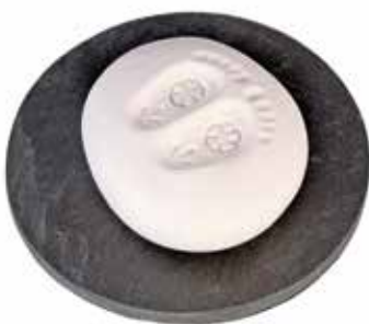
5531 Duftkeramik-Figur „Buddhas Füße“ 2tlg. 8,90€ mit Untersetzer aus Schiefer ø7,5cm, 2,8cm hoch