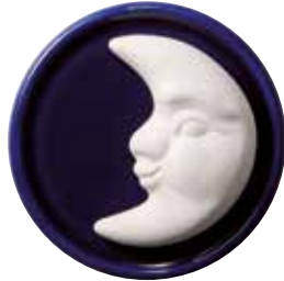
5656 Duftstein „Mond“ mit festem Untersetzer, ø7cm 1St. 5,90€