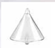
64111 Ersatz-Glasaufsatz für Aroma-Zerstäuber „Profumo“

Der Aroma-Zerstäuber „Profumo“ zerstäubt die feingefilterten Neumond AQUAROMA-Düfte hocheffizient in allen Räumen bis 100m 2 bei besonders leisem Betrieb. Das Zerstäuben der feinen Düfte findet ohne Erwärmung statt (Cold-Air-Diffusion), was einen optimalen Dufteindruck gewährleistet. Die Intensität lässt sich in zwei Stufen steuern. Die integrierte Intervallschaltung unterbricht die Zerstäubung automatisch alle zwei Minuten für eine Minute und erzeugt so einen gleichmäßigen und wohldosierten Dufteindruck. Nach zwei Stunden Gesamtzeit wird der laufende Zyklus automatisch beendet.