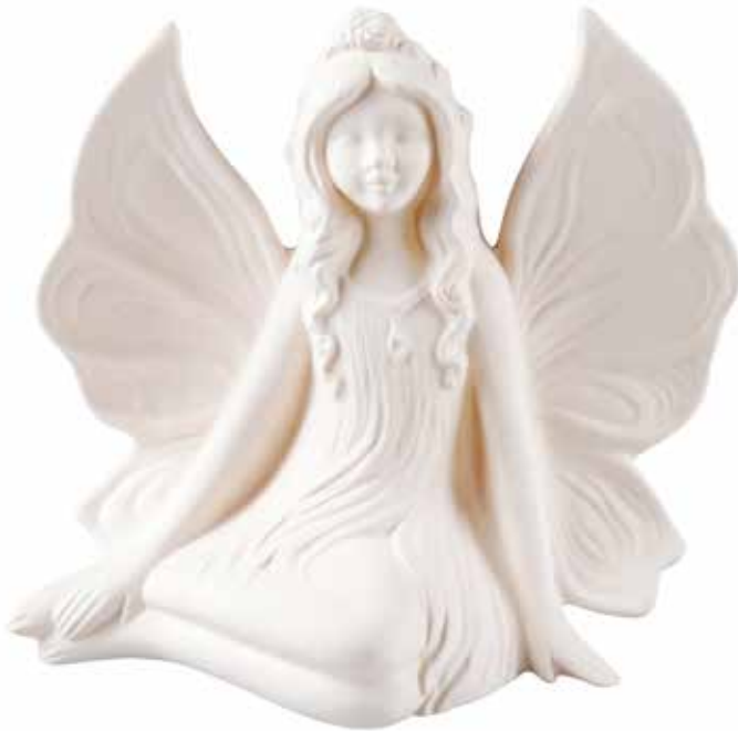
5543 Duftkeramik-Figur „Blüten-Elfe“ 1tlg. 14,00€ 1-teilig ohne Untersetzer, 16cm hoch, ø ca. 17cm

Bei vielen Sets sind die Duftkeramiken zusammen mit den passenden Untersetzern verpackt. Verwenden Sie die bewährten Neumond-Duftkeramiken, um schnell und unkompliziert feinen Duft zu verströmen, z.B. zur Konzentration am Arbeitsplatz oder beim Entspannen auf dem Sofa. Alle Figuren sind schön ausgeformte, beliebte Motive.