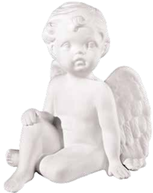
5544 Duftkeramik-Figur „Engel sitzend“ 1tlg. 14,00€ 1-teilig ohne Untersetzer, 15,5cm hoch, ø13cm