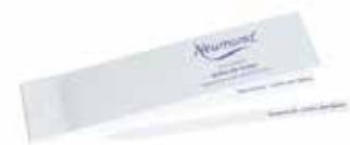
2495 Duftstreifen-Block mit 50 Streifen 1St. 2,90€

50 Vlies-Verdunster mit Motiv „Blütentropfen“, mit Kordel, ca. 11cm hoch, ca. 7cm breit.