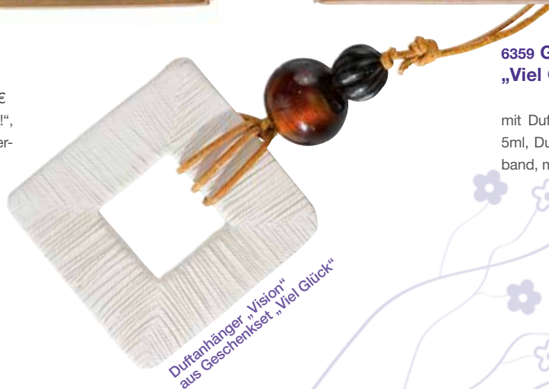
Duftanhänger „Vision“ aus Geschenkset „Viel Glück“

1Set 14,90€ mit Duftkomposition „Viel Glück!“, 5ml, Duftkeramik „Vision“ mit Zierband, mit Dekopapier in Karton.