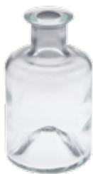
5440 AQUAROMA- Duftglas rund (leer, ohne Stäbe)

1St. 3,90€ Duftglas für AQUAROMA, quadratisch, Glas: 6x6cm, 12cm hoch