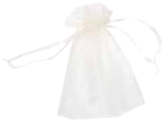
3716 Geschenksäckchen „Organza“, 13x17cm, champagnerfarben mit Zugbändchen 1St. 1,25€