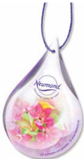
2705 Duft-Vlies „Blütentropfen“ 2er-Pack 1Pk. 1,00€

2 Vlies-Verdunster mit Motiv „Blütentropfen“, mit Kordel, ca. 11cm hoch, ca. 7cm breit.