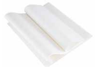
0003 Seidenpapier für Breuss-Massage, 20 Blatt á 24x70cm 20Blatt 6,90€