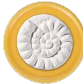
5669 Duftkeramik „Ammonit“, ø 5cm, ohne Untersetzer 1St. 3,50€