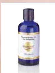
61210 Spezialreiniger bio für Duftgeräte