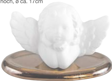
5535 Duftkeramik-Figur „Engelskuss“ 2tlg. 9,90€ mit ovalem, goldfarben glasiertem Untersetzer, 7,5cm hoch, ø ca. 12cm