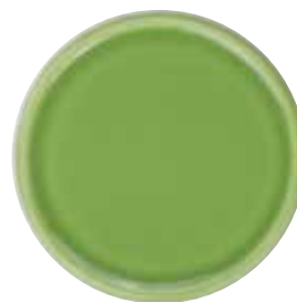
5752 Untersetzer für Duftkeramik, hellgrün glasiert, ø7cm 1St. 2,90€