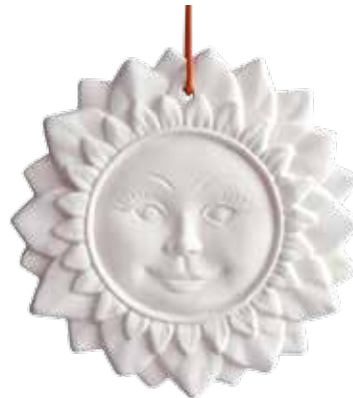
5521 Duftkeramik-Figur „Sonne groß“ mit Lederband 1tlg. 5,90€ ø10cm