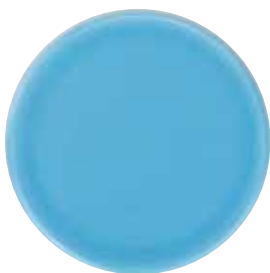
5760 Untersetzer für Duftkeramik, blau glasiert, ø7cm 1St. 2,90€