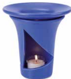
61657 Duftlampe „Toscana“, Keramik himmelblau