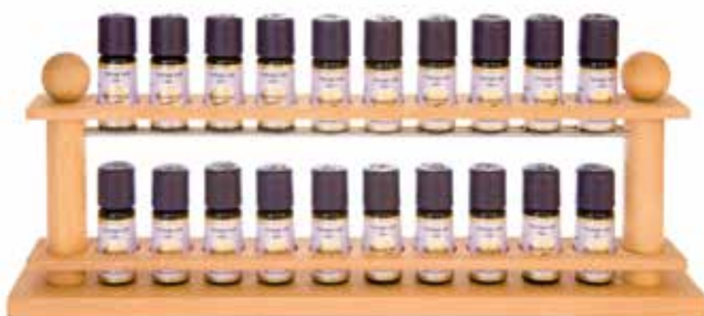
2476 Holz-Duftöl- ständer, leer, für 20 Fläschchen 1St. 28,50€ Buchenholzständer, gedrechselt, mit Leinöl eingelassen. 41cm breit, 6cm tief, 14cm hoch.