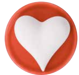
5651 Duftkeramik „Herz“, ø 5cm, ohne Untersetzer 1St. 3,50€