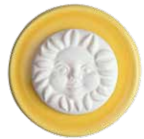
5660 Duftkeramik „Sonne“, ø 5cm, ohne Untersetzer 1St. 3,50€