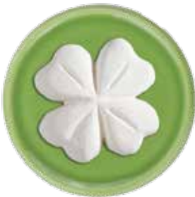
5662 Duftkeramik „Kleeblatt“, ø 5cm, ohne Untersetzer 1St. 3,50€