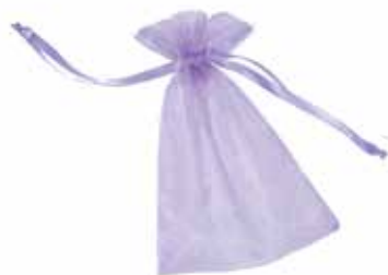
3711 Geschenksäckchen „Organza“, 13x17cm, fliederfarben mit Zugbändchen 1St. 1,25€